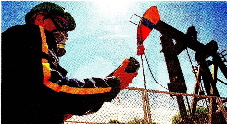
La petrolera reportó ventas por $38,5 billones en el primer trimestre del 2023. Ecopetrol

Ecopetrol informó que el costo de ventas presentó