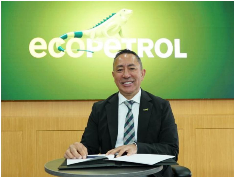
Presidente de Ecopetrol , Ricardo Roa, quien inició en su cargo hace casi dos semanas.

El presidente de Ecopetrol recalcó que durante estos tres meses se registró un aumento importante de cerca 50.000 barriles diarios