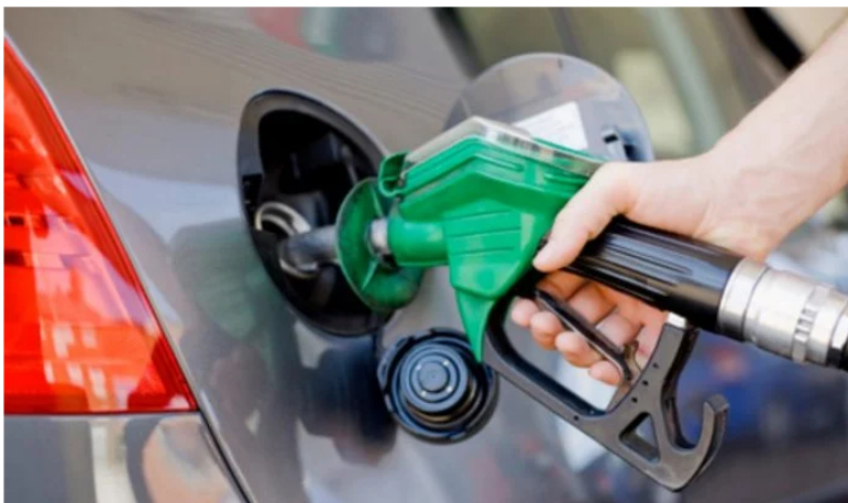
Precio de la gasolina en Colombia.

Por Yennyfer Sandoval - Periodista Minería y Energía - 2023-05-08