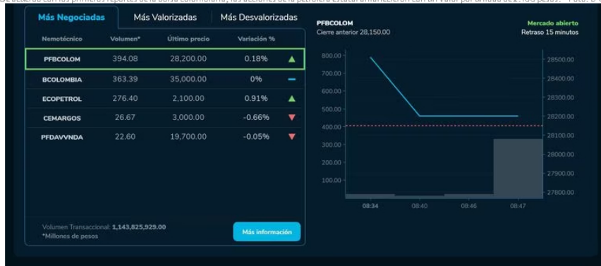
De acuerdo con los primeros reportes de la bolsa colombiana, las acciones de la petrolera estatal amanecieron con un valor por unidad de 2.100 pesos.

No hay que olvidar que el pasado viernes 5 de mayo esta firma puso fin a una seguidilla de casi una semana cerrando con números en rojo. Las acciones de la petrolera estatal terminaron la semana pasada como las más negociadas del día, crecieron un 4,57 % y acabaron con un precio por unidad accionaria de 2.081 pesos. Regresando a la barrera de los 2,000 pesos y dando un poco de tranquilidad a los operadores en ese entonces.