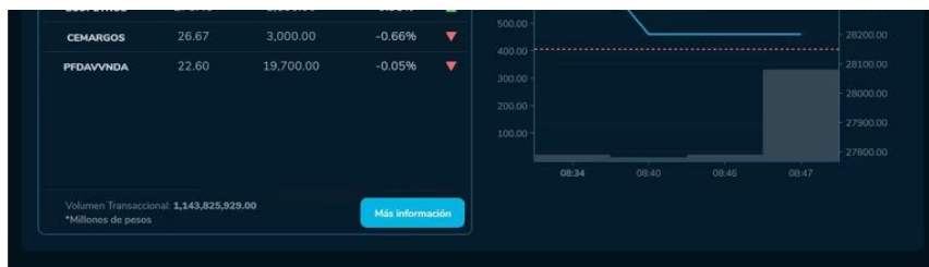
De acuerdo con los primeros reportes de la bolsa colombiana, las acciones de la petrolera estatal amanecieron con un valor por unidad de 2.100 pesos.