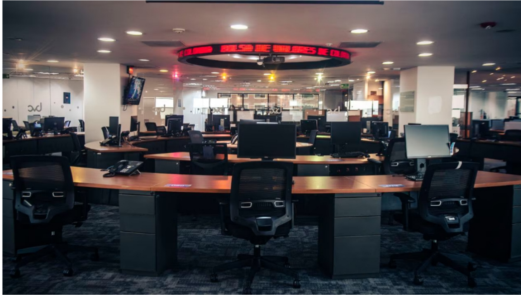
Esta jornada en la Bolsa de Valores de Colombia arrancó con alta volatilidad.

Con buen paso arrancó esta semana para Ecopetrol en la Bolsa de Valores de Colombia, luego de que este lunes 8 de mayo iniciara la jornada con nuevos repuntes en su cotización, luego de varios días de fuertes noticias para los mercados bursátiles en todo el mundo que ahora se concentran en lo que pueda venir en materia de lucha contra la inflación, luego de los ajustes de tasas de interés y datos de inflación que dieron recientemente y ayudaron a calmar los ánimos entre los inversionistas.