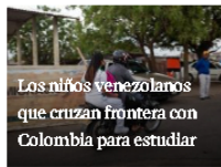
Los niños venezolanos que cruzan frontera con Colombia para estudiar