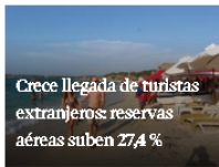
Crece llegada de turistas extranjeros: reservas aéreas suben 27,4%