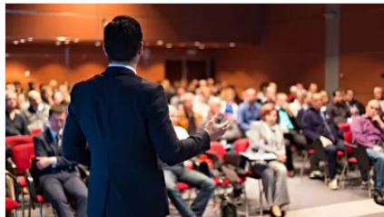
Colombia acogerá cursos gratuitos para aprender a invertir en la bolsa

secreto de la diabetes revelado | Patrocinado