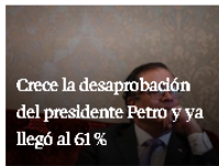
Crece la desaprobación del presidente Petro y ya llegó al 61%