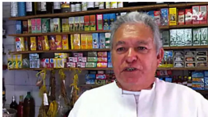
Ex diabético de Bogotá dice cómo mantener la glucosa en 85

secreto de la diabetes revelado | Patrocinado