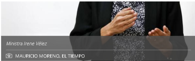
Ministra Irene Vélez