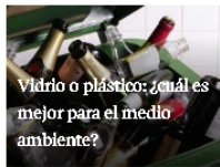
Vidrio o plástico; ¿cuál es mejor para el medio ambiente?