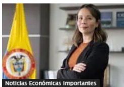
Noticias Económicas Importantes

¿Qué pasó con el volcán Nevado del Ruiz este viernes 5 de mayo?