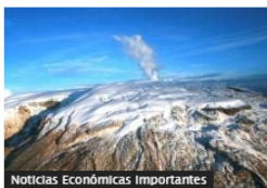
Noticias Económicas Importantes

¿Qué pasó con el volcán Nevado del Ruiz este viernes 5 de mayo?