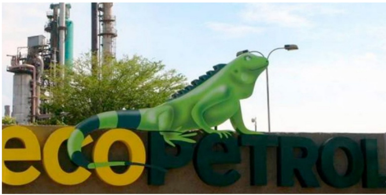
El tema político ha afectado el desempeño del título de Ecopetrol en bolsa.

En el segundo puesto encontramos las acciones de Bancolombia preferencial (Pfbcolom + 0.18%) que negocio $10650 millones. Finalmente, en la tercera casilla tenemos a Bancolombia ordinaria (Bcolombia + 0.57%) que transó un monto de $5.207 millones.