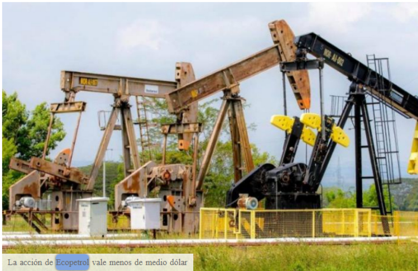
La acción de Ecopetrol vale menos de medio dólar