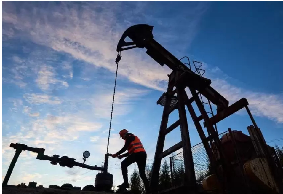
La compañía está buscando gas para abastecer el mercado interno colombiano