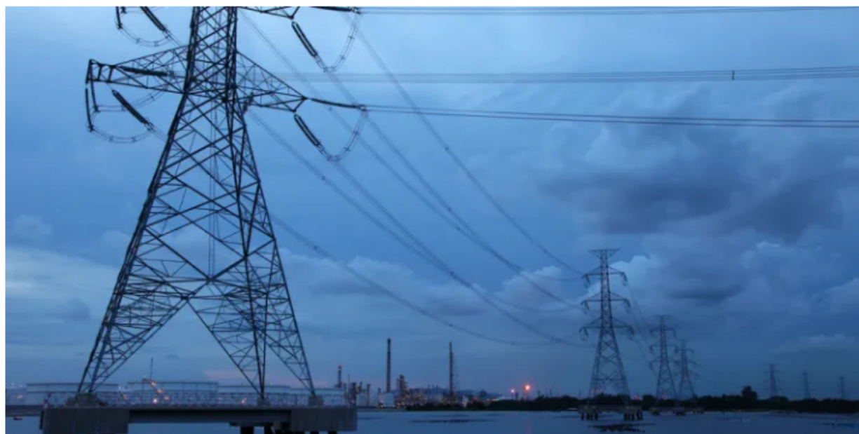
Torres eléctricas en la costa

by Staff Oil & Gas Magazine — mayo 4, 2023