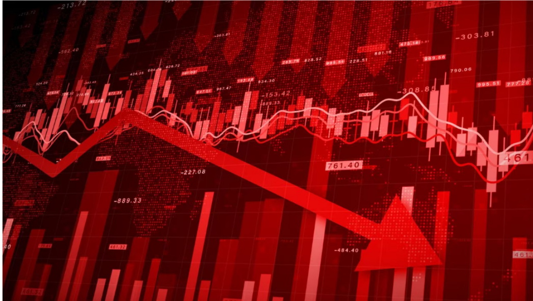
Ya son varias jornadas seguidas de números en rojo para Ecopetrol en la BVC.

Las acciones de Ecopetrol no paran de caer en la Bolsa de Valores de Colombia y este miércoles 3 de mayo completaron un día más de caídas en el mercado local, afectadas por la falta de confianza que hay entre los inversionistas y los desplomes del precio internacional del petróleo; además de la expectativa que hay entre los inversionistas por todo el ruido que se está generando en el mercado tras los cambios ministeriales que se están registrando en el gobierno del presidente Gustavo Petro.