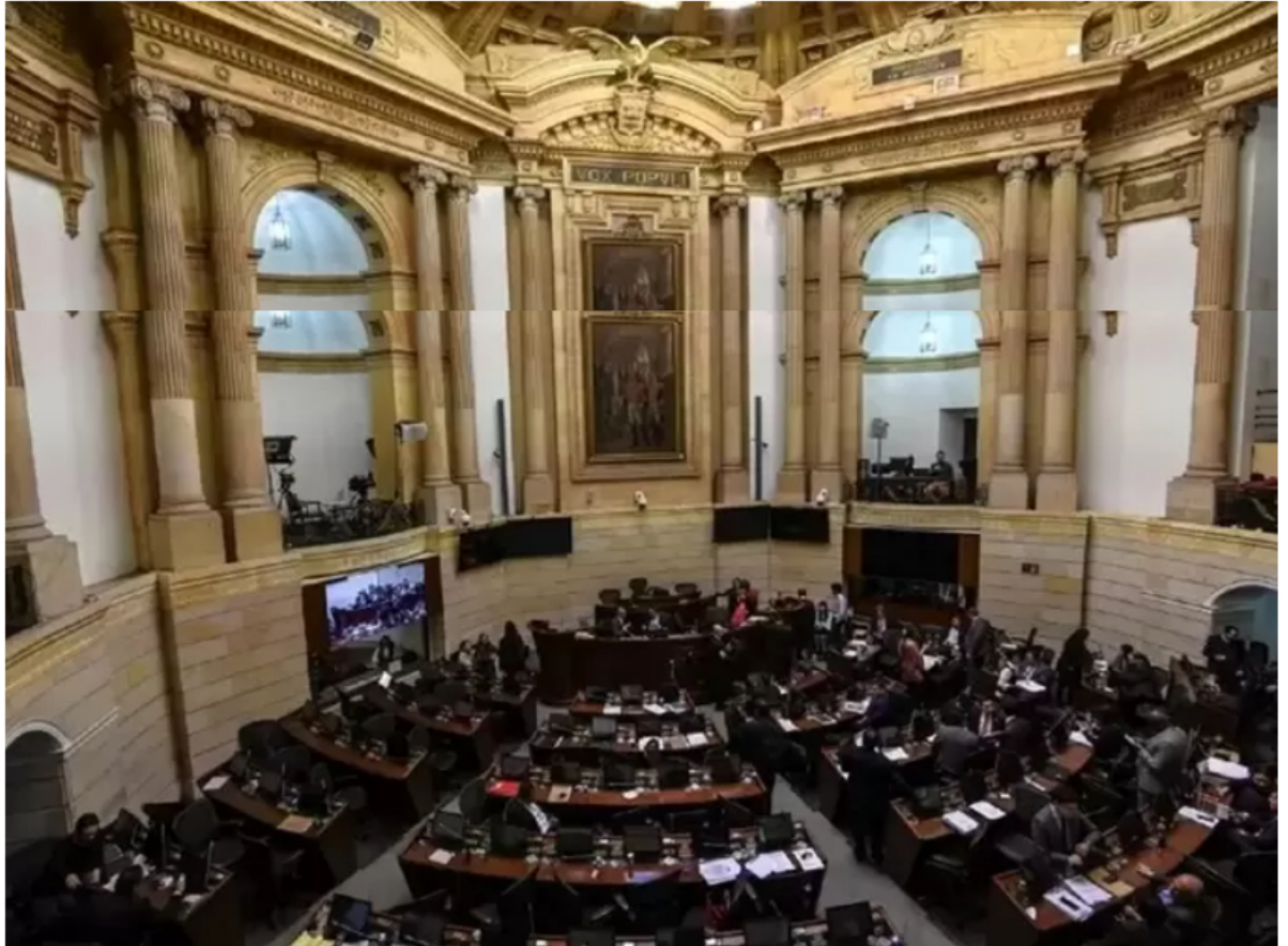
Vista general del recinto del Congreso de la República.