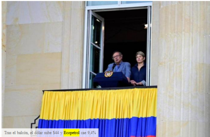
Tras el balcón, el dólar sube $44 y Ecopetrol cae 9,4%