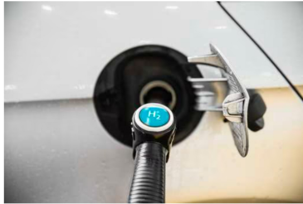
Caribe, pilar en la transición energética