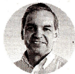
Ricardo Bonilla Ministro de Hacienda

El promedio anual de producción, entre marzo de 2022 y el mismo mes de 2023, fue de 768.427 barriles de petróleo por día, lo que representa un incre-