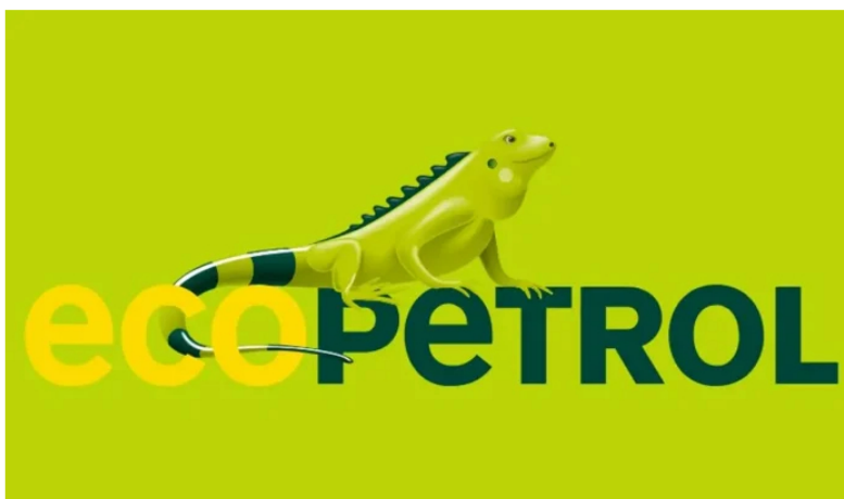
El 9 de mayo, Ecopetrol presentará resultados financieros del primer trimestre de 2023.