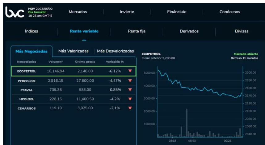
Comportamiento del dólar en Colombia

La Bolsa de Valores de Colombia arrancó este martes 2 de mayo con indicadores a la baja y con una alta expectativa de parte de los operadores de este mercado, luego de los anuncios del presidente Gustavo Petro en nombrar nuevas personas en cargos ministeriales, uno de los más polémicos el del exministro José Antonio Ocampo, que según los expertos era quién buscaba calmar los mercados en momentos de incertidumbre económica en el país.