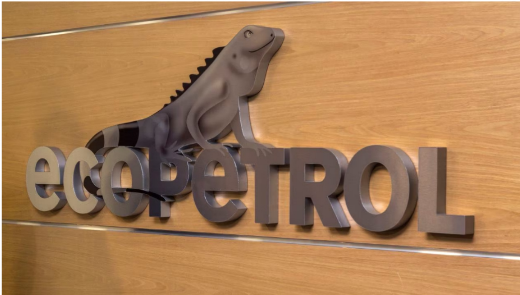
Las acciones de Ecopetrol se desploman. - Foto: Publicaciones Semana

La Bolsa de Valores de Colombia arrancó este martes 2 de mayo con indicadores a la baja y con una alta expectativa de parte de los operadores de este mercado, luego de los anuncios del presidente Gustavo Petro en nombrar nuevas personas en cargos ministeriales, uno de los más polémicos el del exministro José Antonio Ocampo, que según los expertos era quién buscaba calmar los mercados en momentos de incertidumbre económica en el país.