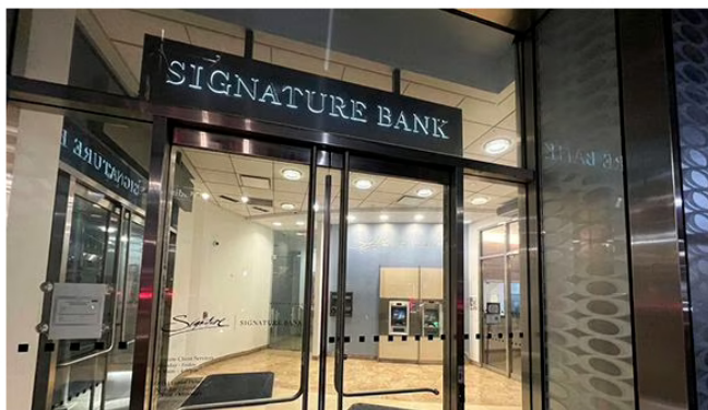
El colapso de Signature Bank se produce tras conocerse la situación del Silicon Valley Bank.

Todo esto tiene lugar un contexto financiero marcado por la quiebra de otra entidad, el First Republic Bank, comprado el fin de semana por el número uno del sector, JPMorgan Chase, luego de que fuera embargado por autoridades federales.