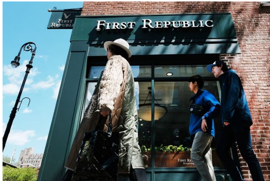
First Republic Bank en Estados Unidos sufrió una gran pérdida este lunes en Wall Street.

El índice industrial Dow Jones cedió un 0,23%, en tanto el Nasdaq, de valores tecnológicos, cayó un 0,18% y el índice ampliado S&P 500 -de las 500 mayores empresas cotizadas- bajó un 0,4%.