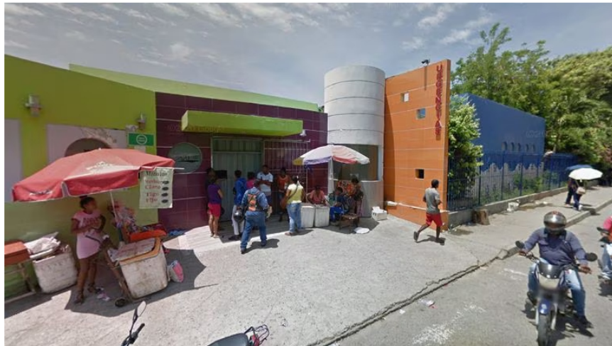
Casa del Niño Cartagena

Por otro lado, los adolescentes fueron atendidos y conducidos a centros hospitalarios de la ciudad donde se les prestó asistencia médica. En este momento, todos se encuentran recuperándose de manera satisfactoria en el hospital infantil Napoleón Franco Pareja, más conocido como la Casa del Niño.