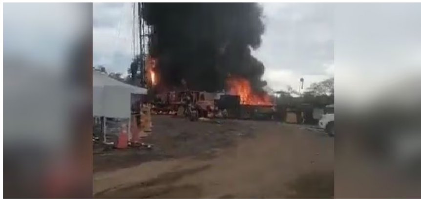
Las causas de la explosión son desconocidas por ahora.

La emergencia, específicamente, se presentó en el pozo Tesoro 29 ubicado en el sector de La Lizama, jurisdicción del municipio de San Vicente de Chucurí , la tarde del pasado sábado 22 de abril. El hecho, por fortuna, no dejó víctimas fatales, pero sí cinco personas heridas.