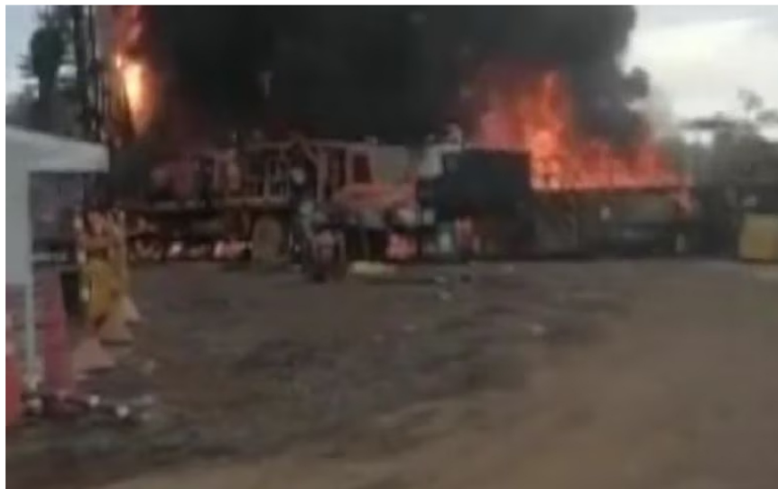
Los heridos por la explosión fueron trasladados a centros asistenciales.