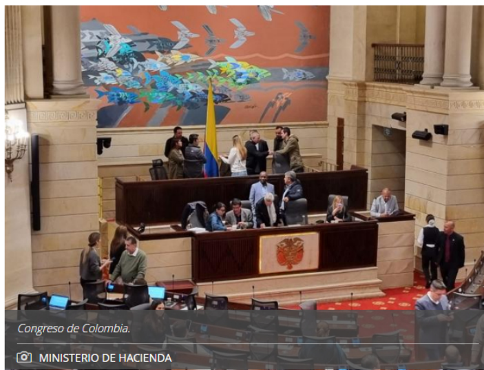
Congreso de Colombia.

La plenaria también eliminó el artículo que aumentaba las transferencias monetarias de los proyectos de generación solar y eólica