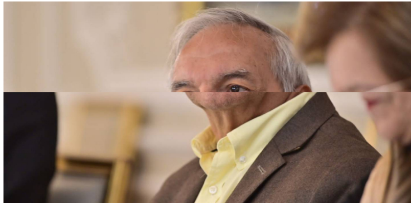
Subsidio a combustibles es un riesgo para cumplir la regla fiscal: Ricardo Bonilla Ricardo Bonilla, ministro de Hacienda

■ El ministro de Hacienda mostró preocupación por el costo de subsidiar los combustibles en el país y reiteró que trabajará por la estabilidad fiscal del país