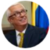
Jorge Enrique Robledo @JERobledo