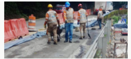
Cierre parcial de la vía Bogotá – Girardot