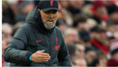
Insólito: técnico Jurgen Klopp se lesiona en victoria del Liverpool contra Tottenham con gol de Luis Díaz