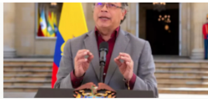
Presidente Petro aplaza nuevamente reunión con Consejo Nacional de Juventud