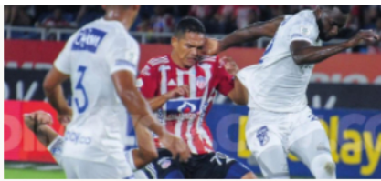
Millonarios perdió su invicto ante el Junior