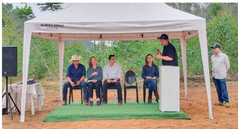
Salomón Sanabria, gobernador de Casanare en la presentación de la planta.

En la actualidad, ese nivel es del 45 % de la economía del departamento al oriente de Colombia dependiendo de actividades relacionadas con los hidrocarburos.