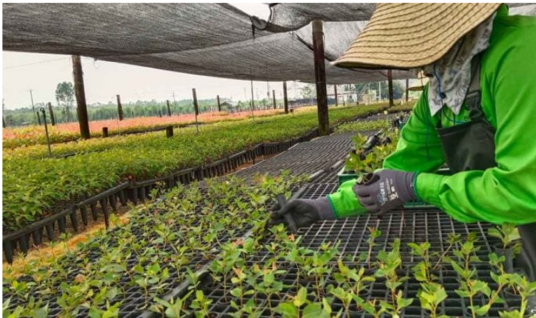
Ecopetrol , Refocosta y EDF se unieron para la primera planta de energía a base de biomasa.

La multinacional francesa EDF se unió con Ecopetrol y con Refocosta para poner en marcha la primera planta de generación de energía en Colombia a base de biomasa y que tendrá como insumo el primer bosque de energía en el municipio de Villanueva, Casanare.