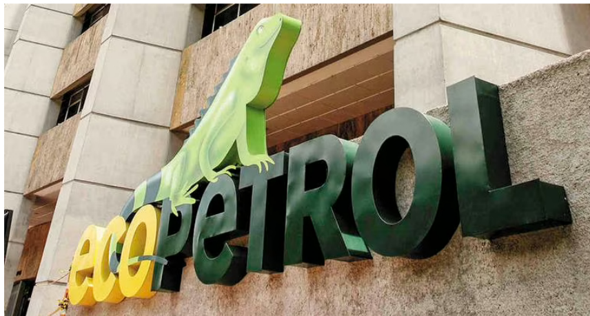
Logo de Ecopetrol

En primer lugar se habla de presuntos direccionamientos en la contratación en el sistema de abastecimiento, en la regional Orinoquia. Así mismo, se investigan los detalles de un contrato para un servicio de helicóptero por más de 150 millones de dólares. El tercer frente tiene que ver con la cartelización del tema de carros blindados que habría tocado las puertas de Ecopetrol, según fuentes consultadas.