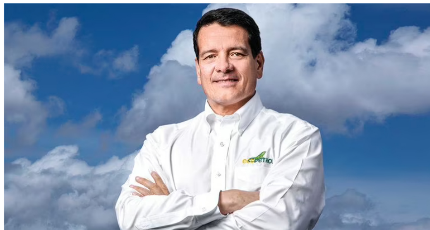
Felipe Bayón, presidente de Ecopetrol

Unos 22 funcionarios de la Delegatura para la Protección de la Competencia se instalaron en el tercer piso de la sede principal de Ecopetrol , en la calle 36 con carrera 13, y en otra sede en Bogotá.