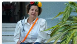
"Mírenme, yo no nací así, esto me lo hicieron aquí en Colombia"