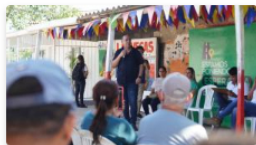
Canalización de tramo del arroyo Cien Pesos estaría lista en 4 meses