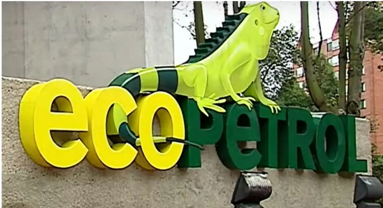
Ecopetrol es la empresa que más dividendos le entrega al país.