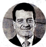
Felipe Bayón Presidente saliente de Ecopetrol

ENERGÍA. LOS ACCIONISTAS MINORITARIOS RECIBIRÁN UN DIVIDENDO ORDINARIO DE $487 POR ACCIÓN, EQUIVALENTE A 60% DE LA UTILIDAD NETA, MÁS EL MONTO EXTRAORDINARIO DE $106 (13%) POR TÍTULO