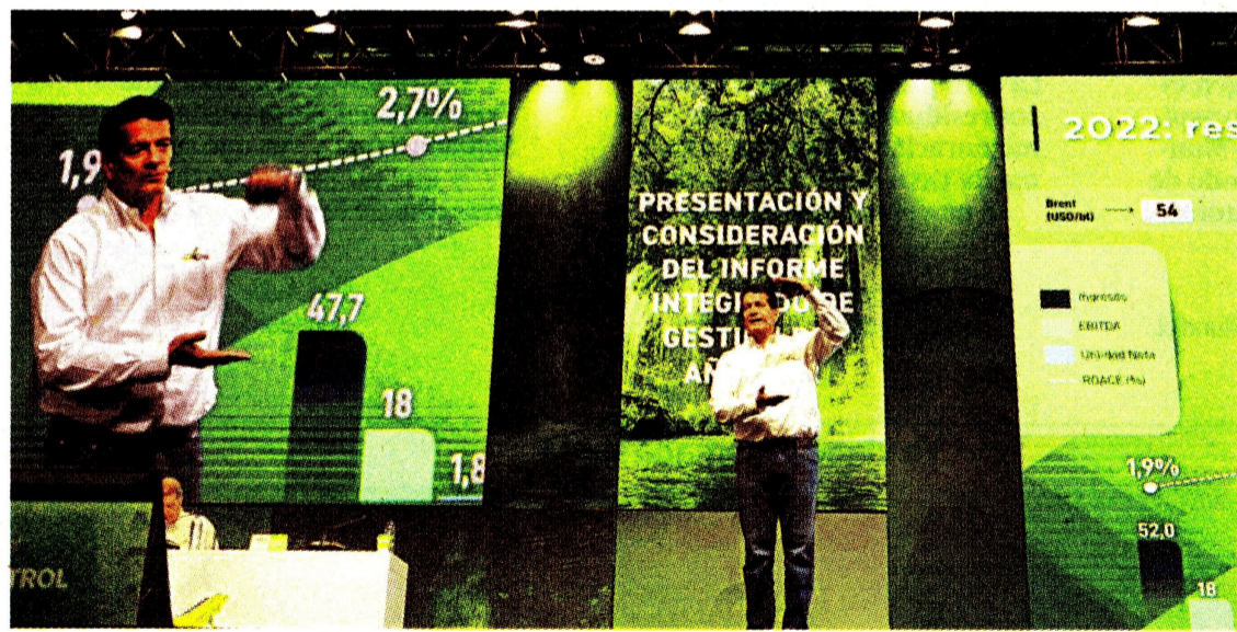
El presidente saliente de Ecopetrol, Felipe Bayón, durante la asamblea de accionistas.

En la asamblea se aprobó repartir $33,2 billones en dividendos. Ayer, la Superindustria hizo una visita a la empresa para determinar si adelanta una investigación por posibles infracciones a la libre competencia. Pág. 7