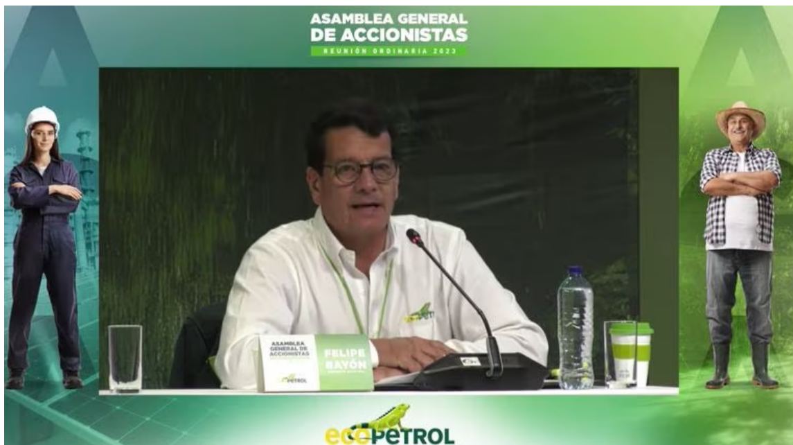
El presidente de Ecopetrol, Felipe Bayón, durante la asamblea de accionistas de la petrolera, la última a la que asistió debido a su retiro del cargo

“Hay una reserva legal que hay que respetar, colaboramos con el suscrito con todas las solicitudes de las SIC. La SIC está haciendo su trabajo, está recabando la información”, señaló.