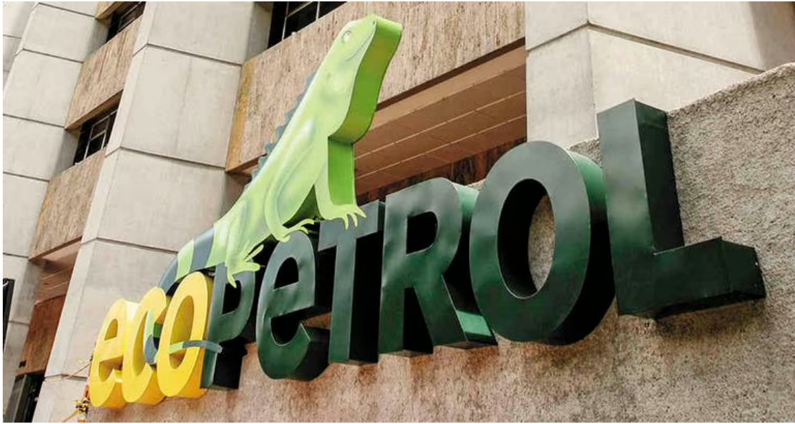
La Superindustria allanó las oficinas de Ecopetrol en búsqueda de información sobre prácticas restrictivas de la competencia y presuntos actos de corrupción. (Imagen de referencia)

Añadió que “es una visita no anunciada. Tuve la oportunidad de estar sentado por varias horas, abordamos temas acogidos en la reserva legal”.