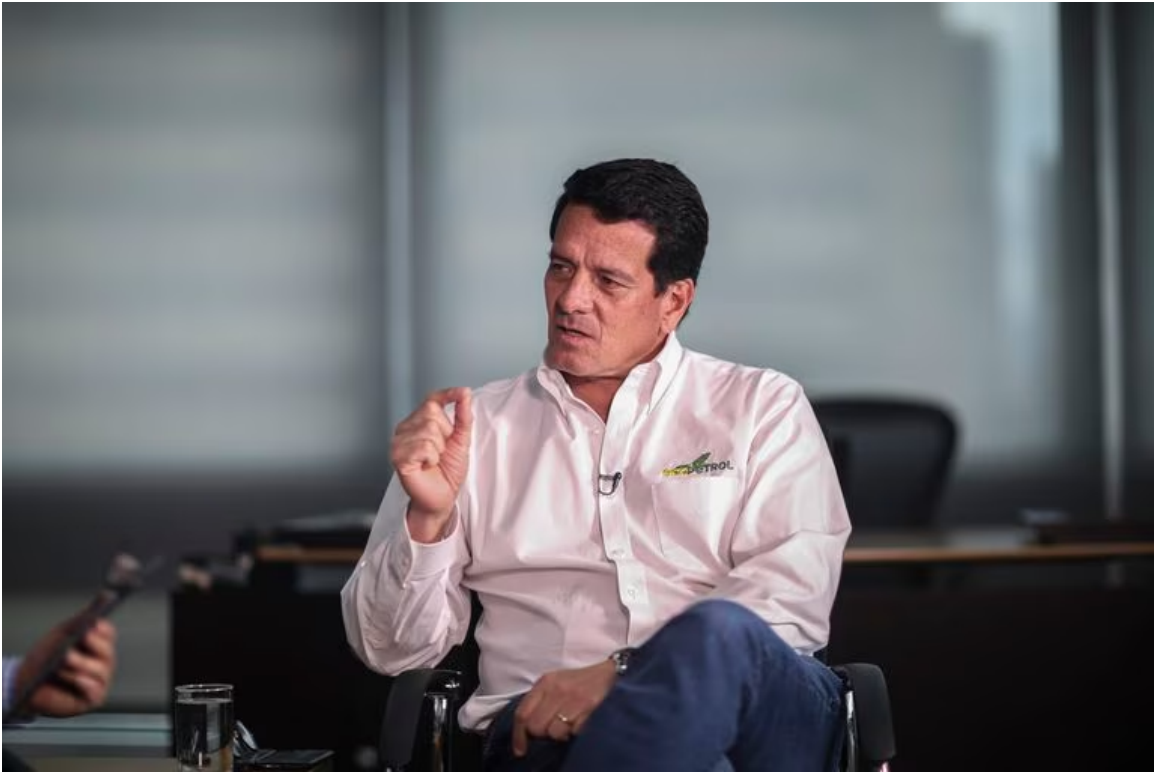
Felipe Bayón, presidente saliente de Ecopetrol, se pronunció, durante la asamblea anual, sobre la visita de la SIC a las sedes de la petrolera en Bogotá (Foto de referencia)

De igual forma, Felipe Bayón, que deja la presidencia de Ecopetrol este viernes 31 de marzo, confirmó que se reunió con funcionarios de la Superintendencia de Industria y Comercio. “Muchos funcionarios estuvimos el día de ayer con ellos”, enfatizó.