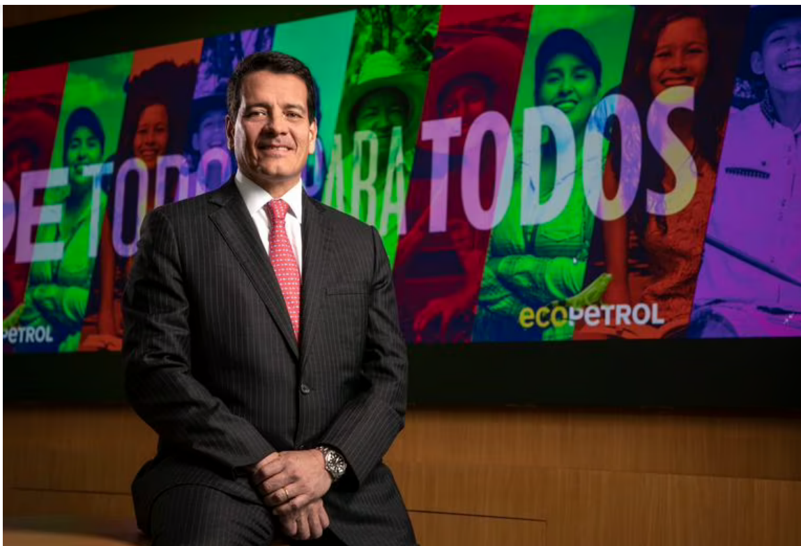
Salida de Felipe Bayón de la presidencia de Ecopetrol se vio rodeada por el allanamiento de la SIC a oficinas de la petrolera en Bogotá

Unos 22 funcionarios de la Delegatura para la Protección de la Competencia de la SIC se instalaron en el tercer piso de la sede principal de Ecopetrol, en la calle 36 con carrera 13, y en otra sede en la capital.