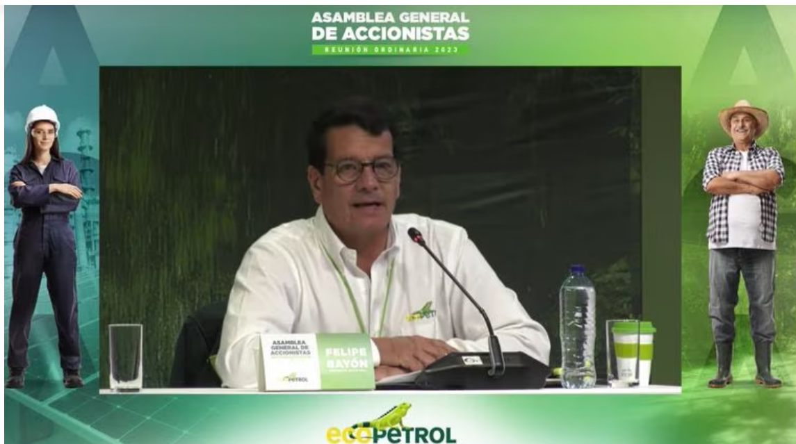
El presidente de Ecopetrol, Felipe Bayón, durante la Asamblea de Accionistas de la petrolera, la última a la que asistirá debido a su retiro del cargo

Sobre las utilidades de la compañía, el presidente Bayón resaltó que fueron el doble del año anterior, es decir, pasó de $16,7 billones en 2021 a $33,4 billones.