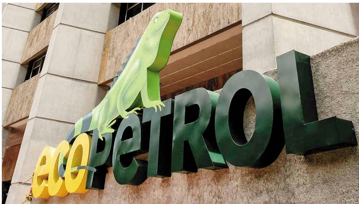
Este jueves, se llevó a cabo en Corferías la Asamblea de Accionistas de Ecopetrol (Imagen de referencia)

Al hacer clic en "Aceptar todas las cookies", usted acepta que las cookies se guarden en su dispositivo para mejorar la navegación del sitio, analizar el uso del mismo, y colaborar con nuestros estudios para marketing.