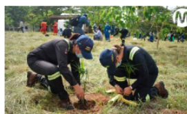
En el último año Ecopetrol