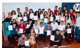
Ecopetrol busca fomentar la