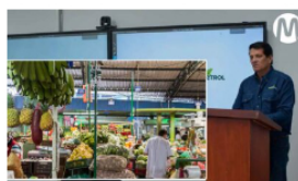
Ecopetrol y FAO firman