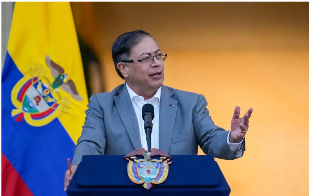
El presidente colombiano, Gustavo Petro.

El presidente Gustavo Petro manifestó su repudio y convocó a consultas por la situación.