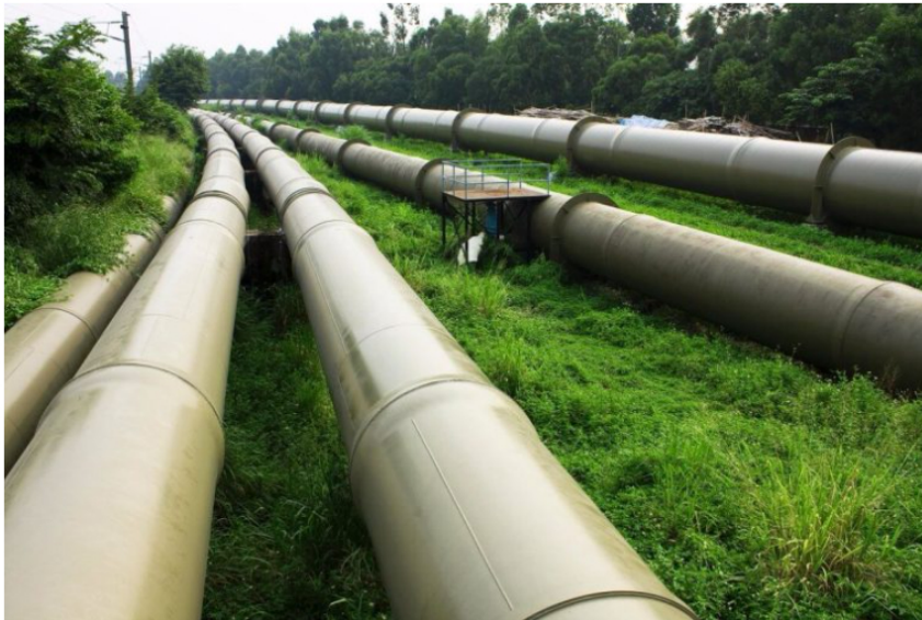
Venezuela no puede surtir de gas y combustible a Colombia porque tiene varias fallas técnicas