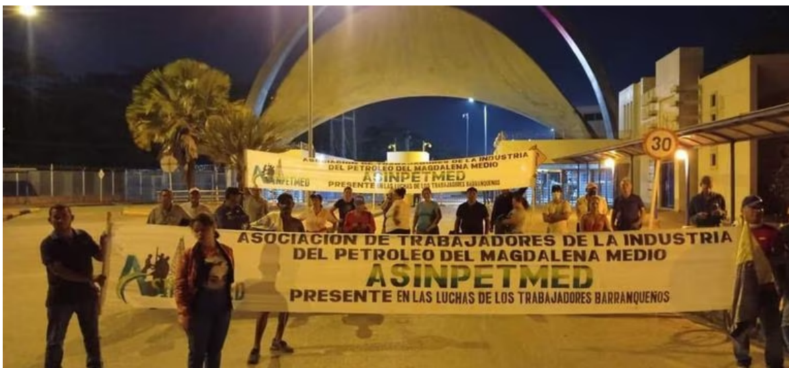
Bloqueos en la refinería de Ecopetrol en Barrancabermeja.