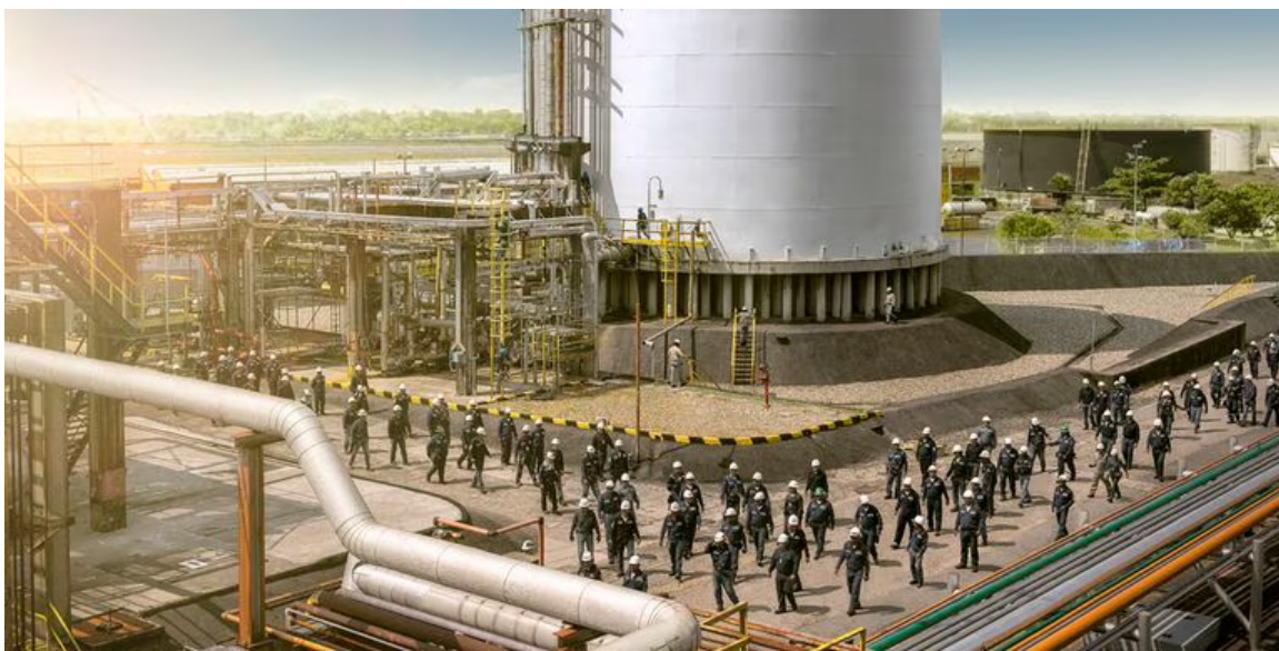
El trabajo de 1500 empleados se vio afectado. (Imagen de referencia).

De acuerdo con Ecopetrol, la mano de obra local (tanto calificada como no calificada) se prioriza en la contratación con el fin de contribuir a la prosperidad económica de la región. Por ello, en enero (2023) 2.907 trabajadores locales de Barrancabermeja laboraron en la refinería; es decir, el 95,5% del total de personas vinculadas por las empresas contratistas. En esta cifra se destacan poblaciones de difícil inserción laboral como mujeres (715), jóvenes entre 18 y 28 años (365), víctimas del conflicto armado (32), discapacitados (5), primer empleo (22) y grupos étnicos (32), entre otros.