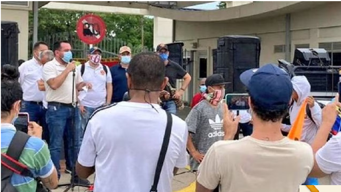
Manifestantes reclaman mayor contratación de mano de obra local.