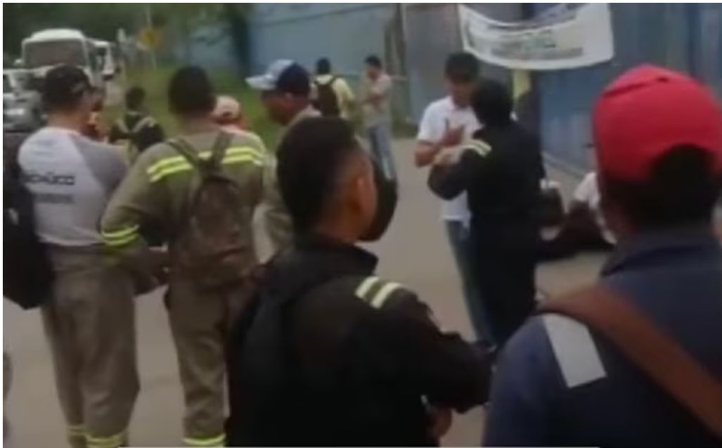
Bloqueos en refinería de Ecopetrol en Barrancabermeja.