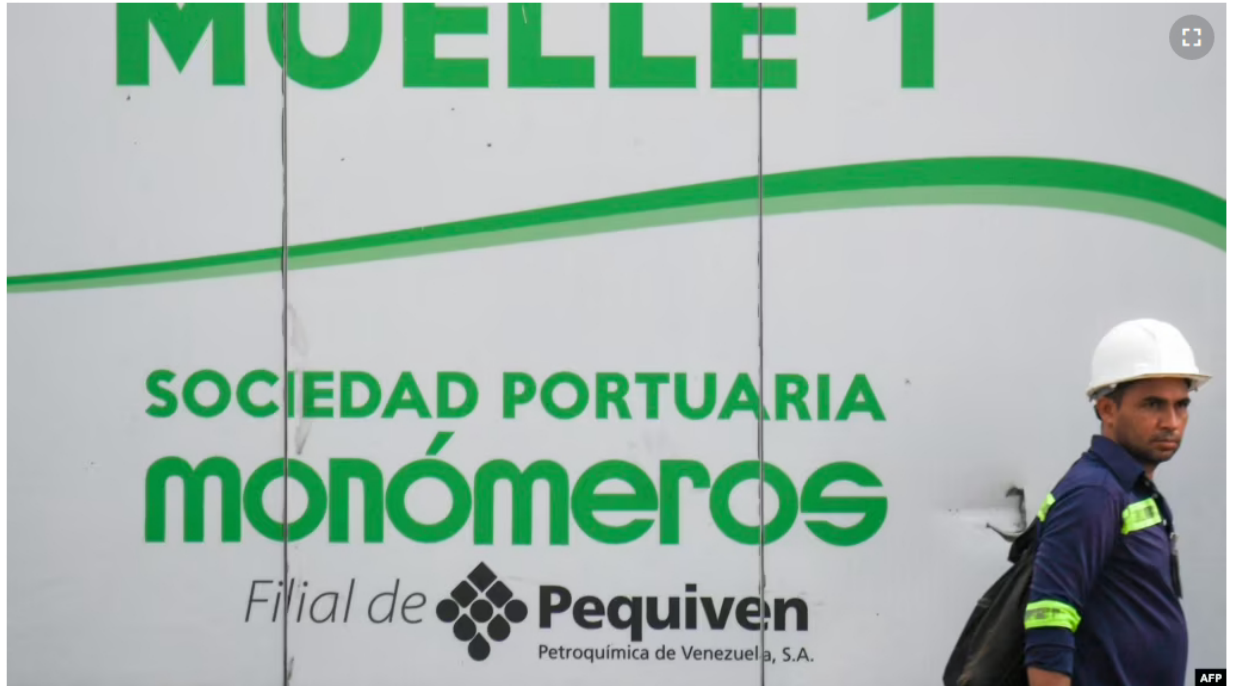
Un trabajador camina frente a un letrero de la empresa venezolana de fertilizantes Monómeros, en Barranquilla, Colombia, el 9 de octubre de 2021.

Los expertos coinciden en que vender la empresa colombo-venezolana Monómeros, uno de los mayores activos de Venezuela, por 300 millones de dólares, sería “literalmente regalarla”. Opinan que la empresa está “subvalorada”.