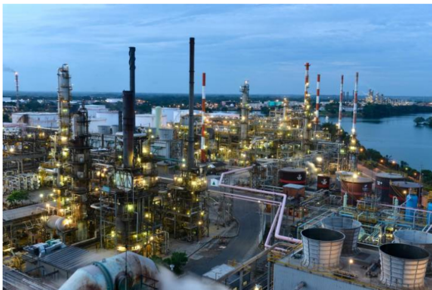
En enero de 2023, 2.907 trabajadores locales de Barrancabermeja laboraron en la refinería; es decir, el 95,5 % del total de personas vinculadas por las empresas contratistas.

1.500 trabajadores de 30 empresas contratistas no pudieron ingresar a laborar a la refinería de Barrancabermeja. El bloqueo a los accesos también impidió el ingreso y cargue de carrotaques que transportan productos combustibles, petroquímicos e industriales para el consumo nacional.