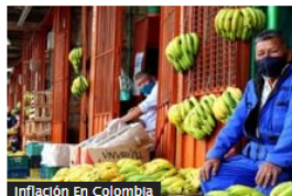
Inflación en Colombia: así están