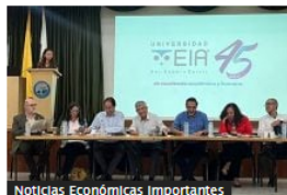
Director del DNP lanza nuevos