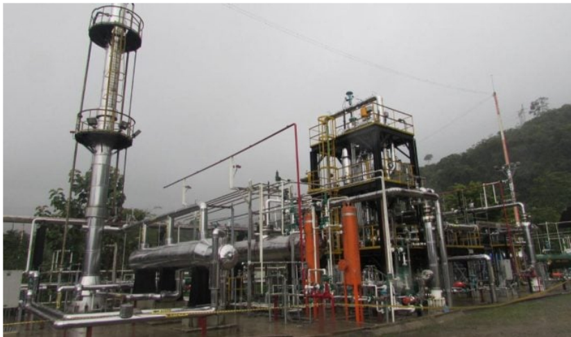
Planta de Gas de Gibraltar Ecopetrol

Por Yennyfer Sandoval - Periodista Minería y Energía - 2023-03-28