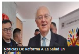
Esto costarán las reformas