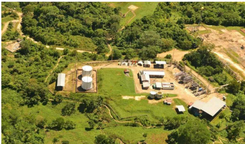
Planta de Gas de Gibraltar Ecopetrol

La decisión de la compañía petrolera está anclada al objetivo de garantizar la seguridad de las operaciones.