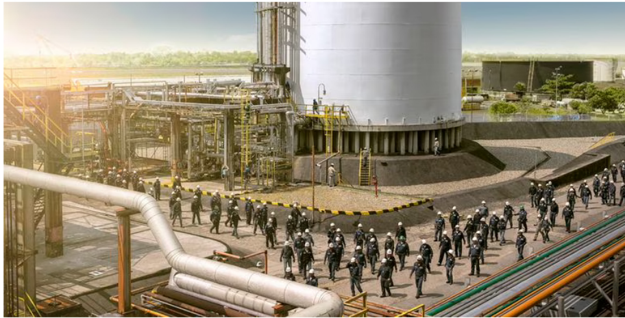
El trabajo de 1500 empleados se vio afectado. (Imagen de referencia).

No obstante, “ se respeta la autonomía de las empresas aliadas, las cuales libremente, sin ningún tipo de presiones, y en cumplimiento de sus obligaciones legales y contractuales, pueden seleccionar y vincular al personal que consideren necesario y que en todo caso han cumplido con sus compromisos de vinculación de mano de obra local”, puntualizó Ecopetrol .