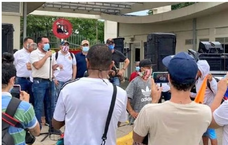
Manifestantes reclaman mayor contratación de mano de obra local.

Ante esta situación, la empresa rechazó el actuar de los manifestantes y aseguró que en enero contrató un gran porcentaje de mano de obra local.