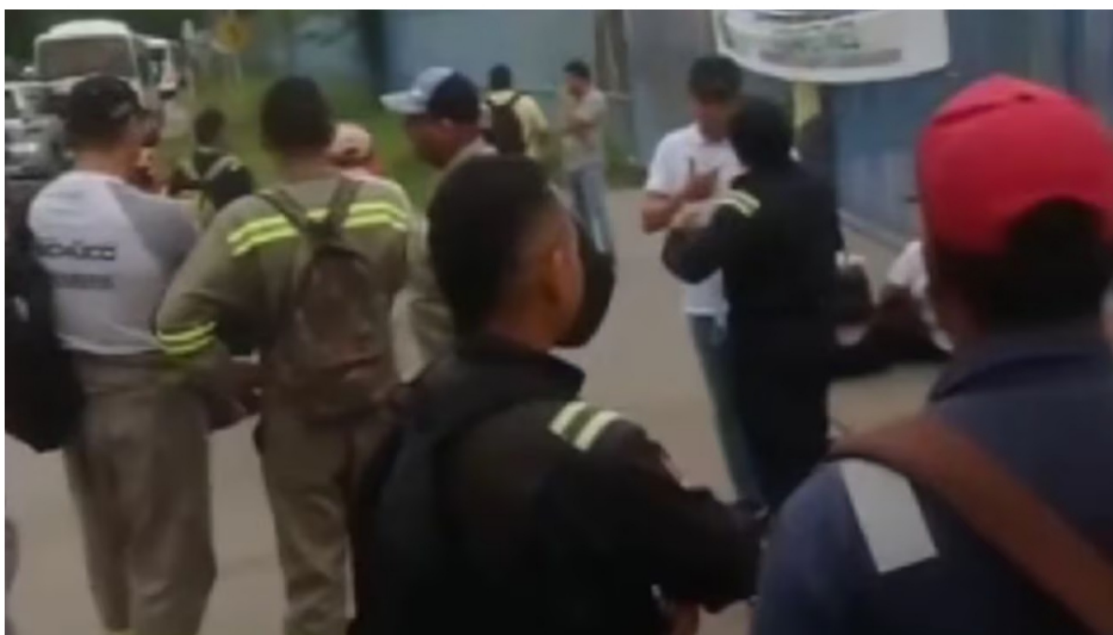
Bloqueos en refinería de Ecopetrol en Barrancabermeja.

Totalmente bloqueadas quedaron las cuatro entradas de la refinería de Ecopetrol en Barrancabermeja (Santander), debido al plantón y manifestaciones que realizó un grupo de residentes del municipio, quienes exigen mayor contratación local y menos foránea.