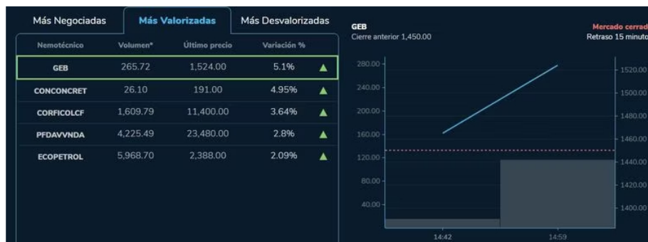
Estas fueron las acciones que más se valorizaron en la bolsa este 28 de marzo de 2023.

Por último, se destaca que las acciones que más se valorizaron fueron las del Grupo Energía de Bogotá (5.1%), Concreto (4.95%), Corficolombiana (3.64%), Davivienda (2.8%) y Ecopetrol (2.09%) . Contrario a las de Bancolombia, ISA, BHI, Grupo Sura y CNEC, que fueron las que más se desvalorizaron en la jornada de este martes 28 de marzo en la bolsa colombiana.