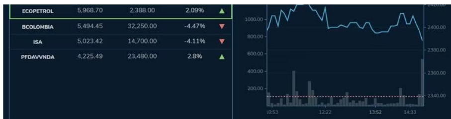
Las acciones de Ecopetrol finalizaron en terreno positivo en la jornada de este 28 de marzo de 2023.

Con respecto a Ecopetrol , el comportamiento de las acciones viene registrando un mejor panorama, al cerrar con una variación positiva de 2.09% al cotizarse en $2.388,00 . Arrancó su cotización en bolsa con un precio de $2.400,00, alcanzando su pico más alto $2.429,00 dos horas después de la hora de apertura, sin embargo, perdió fuerza al cierre de la jornada. Pese a ello, las acciones de la petrolera colombiana llevan tres días consecutivos en verde.