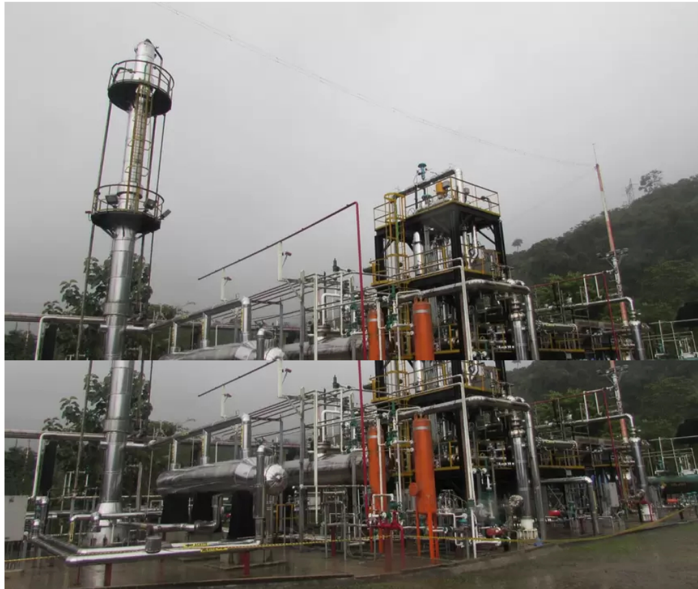
Oleoducto Caño Limón-Coveñas