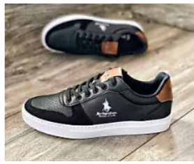
Los tenis mas cotizados en usa, ya están en colombia a precio de