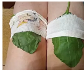
¡Los que sufren de dolor de rodilla y cadera deberían leer