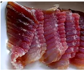
¡La diabetes no es por lo dulce! Conoce al enemigo de la diabetes!