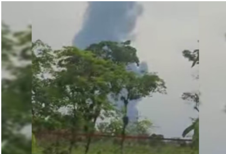
Por el momento no se registran víctimas mortales.