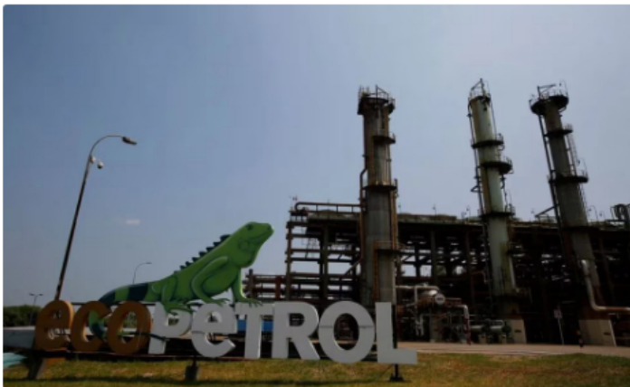
Foto de archivo. Panorámica de la entrada a la Refinería de Ecopetrol en Barrancabermeja, Colombia, 1 de marzo, 2017.

Las Asociaciones de trabajadores afines a la industria del petróleo efectuaron bloqueos de personal en la entrada de la refinería de Ecopetrol en su sede Barrancabermeja,