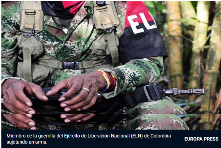
Miembro de la guerrilla del Ejército de Liberación Nacional (ELN) de Colombia sujetando un arma.

La instalación es un objetivo recurrente de ataques por parte del brazo armado terrorista del ELN a lo largo de los últimos años