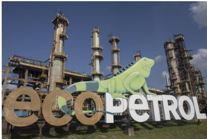
Ecopetrol : Señalización en la refinería de Ecopetrol Barrancabermeja en Barrancabermeja, Colombia, el martes 15 de febrero de 2022.

Luego de que se divulgara esta información, Ecopetrol ha salido a responder sobre la forma en la que se define esta compensación .