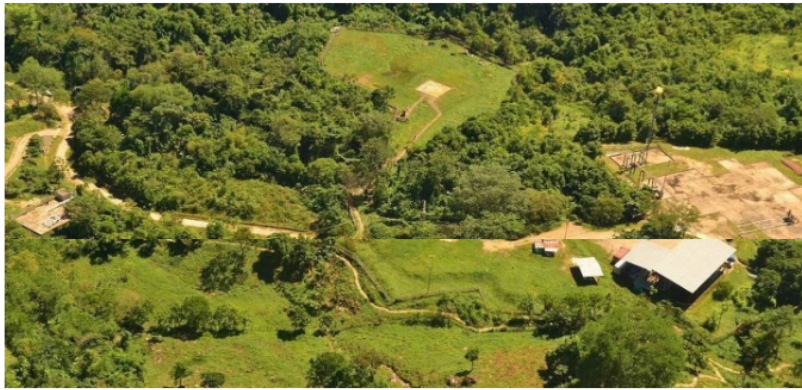
Campo Gibraltar de Ecopetrol

■ Desde La Planta de Gas de Gibraltar es de gran importancia para la seguridad energética del país pues de allí se despachan 38 millones de pies cúbicos diarios de gas natural