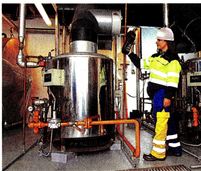
Según un estudio, para que la transición energética sea exitosa en el país, se debe incrementar el uso del gas en un 50 por ciento.