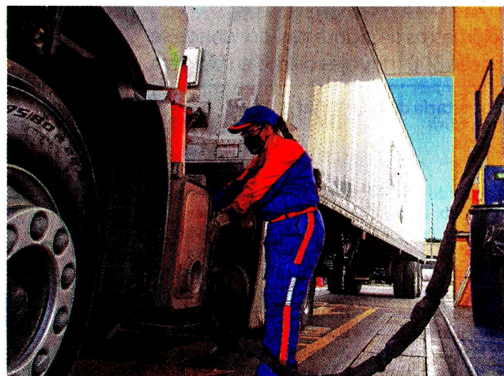
En el 2022 se vendieron solo 400 vehículos de transporte de carga pesada a gas natural, frente a 10.000 diésel.

tural en los vehículos de transporte de carga, bien sean urbanos o interurbanos, van más allá de las que son decisivas para la preservación del ambiente, e involucran ventajas económicas para quienes se decidan por esta opción.