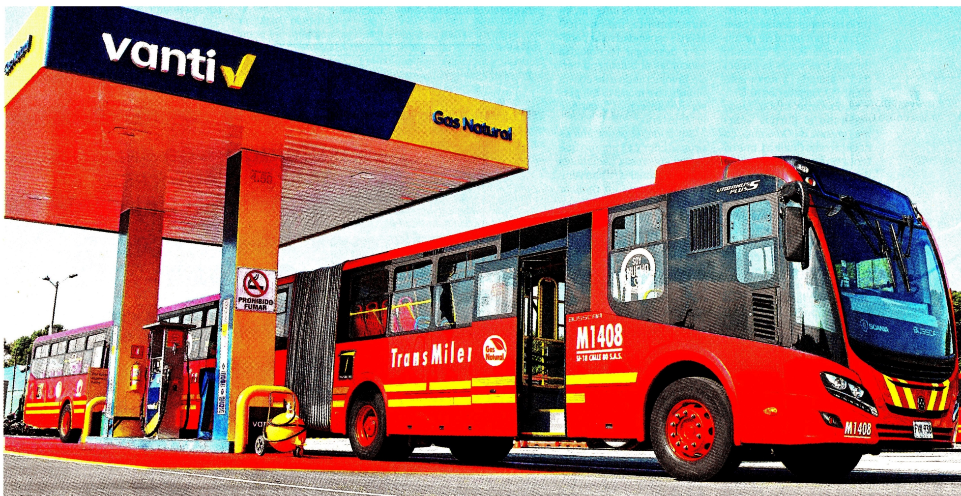
Existen 800 buses articulados y biarticulados a gas, además de 1.200 padrones que funcionan con gas natural de la empresa Vanti. Esta transición en tecnología le mereció un reconocimiento a la capital del país, por parte de la Unión Internacional del Gas en Corea, en la Conferencia Mundial del Gas del año 2022.

De otro lado, también se habló de una nueva tecnología europea que llegó al país para hacer que el calentamiento del agua se realice de una manera con la que, además de ahorrar el líquido, se disminuyan las emisiones de dióxido de carbono.