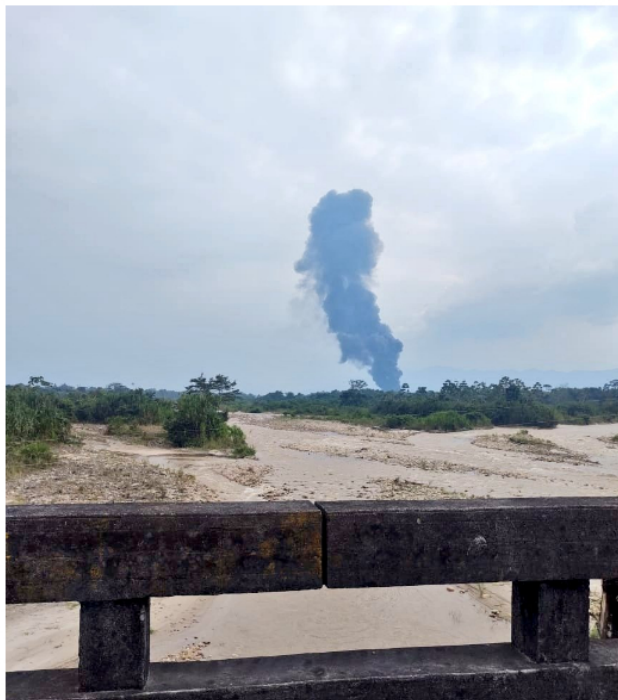
ELN perpetró atentado contra oleoducto Caño Limó Coveñas en Cubará, Boyacá

Finalmente Ecopetrol expresó que "rechazan estas acciones ilícitas y hacen un llamado para que cesen estos delitos contra la infraestructura que ponen en riesgo la integridad de las personas, generan graves consecuencias al medio ambiente y afectan las actividades de las comunidades y de la industria petrolera".