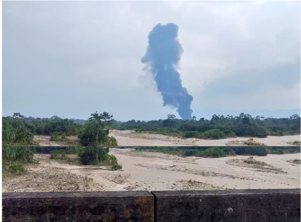
ELN perpetró nuevo atentado contra oleoducto Caño Limón Coveñas