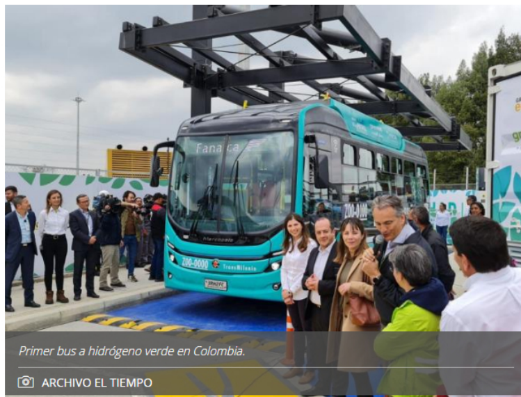
Primer bus a hidrógeno verde en Colombia.

El vehículo, que fue presentado oficialmente este 27 de marzo, cuenta con 450 kilómetros de autonomía, suficiente para más de 3 días de recorrido.