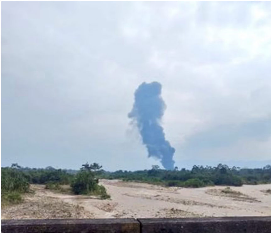
Nuevo atentado al oleoducto Caño Limón-Coveñas.

Un nuevo atentado sufrió el oleoducto Caño Limón-Coveñas , el cual es manejado por Ecopetrol y cubre una distancia de 771 kilómetros . El hecho ocurrió a las 2:40 p. m. del 27 de marzo en la vereda Campo Alicia, zona rural del municipio de Cubará (Boyacá).