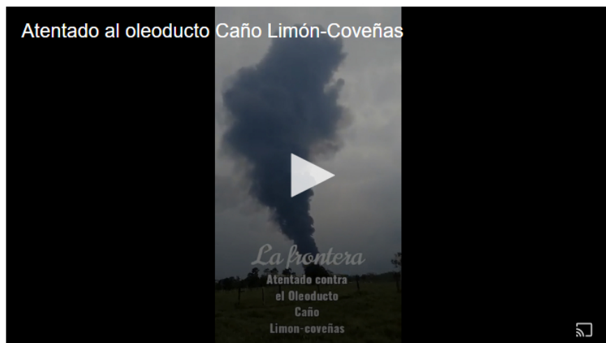
Moradores grabaron momentos en el que se ve la humareda generada por el nuevo atentado al oleoducto Caño Limón-Coveñas.

“Cenit y Ecopetrol rechazan estas acciones ilícitas y hacen un llamado para que cesen estos delitos contra la infraestructura que ponen en riesgo la integridad de las personas, generan graves consecuencias al medio ambiente y afectan las actividades de las comunidades y de la industria petrolera”, manifestó la empresa.